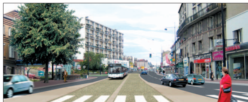
Photomontage : exemple d'insertion du site propre à la Fourchette de Champigny.

Les deux stations suivantes se situent à l'intersection avec le boulevard Stalingrad pour la première et avec la rue Génétrais pour la seconde.